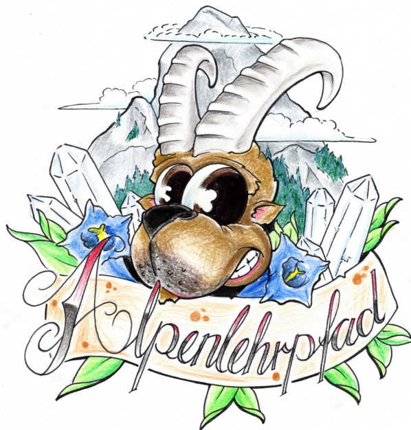
Teil 1 SWISS-EVENTURES © 2011